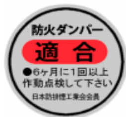
日本防排煙工業会認定シール